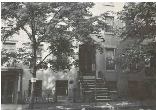
Casa de Bill e Lois no Brooklin, Nova York City

Jerusalém, no Brooklin, Nova York. Depois partiu para a guerra na França com o Batalhão de Artilharia 66 onde serviu como segundo tenente.