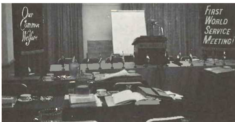
Primeira Reunião de Serviço Mundial