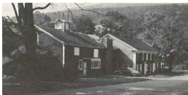
Casa em East Dorset, Vermont, onde Bill W. nasceu.

Nascido em East Dorset, Vermont, no dia 26 de novembro de 1895 , Bill foi o único filho homem de Emily e Gilman Barrows Wilson. Recebeu sua primeira educação numa escola de duas salas em East Dorset e depois em Rutland, Vermont; em 1909 foi estudar no Seminário Burr and Burton em Massachussets e depois na Escola Superior de Arlington, Massachussets.