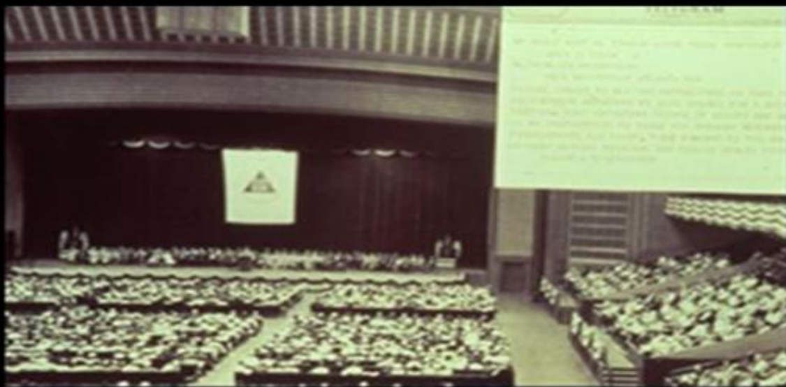
2ª Convenção Internacional, St. Louis, 1955. A declaração de Maioridade