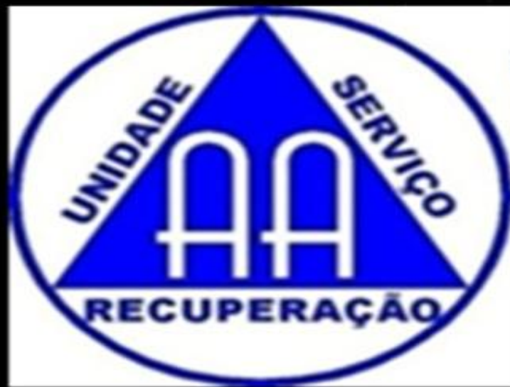
O emblema de A.A.

O objetivo principal da Convenção foi a Declaração da Maioridade da Irmandade. Perante mais de cinco mil pessoas, Bill, falando em nome do Dr. Bob – já falecido – e dos membros mais antigos, declarou a Maioridade de A.A., e transferiu à Conferência de Serviços Gerais e aos Custódios a vigilância e a proteção dos “Três Legados”.