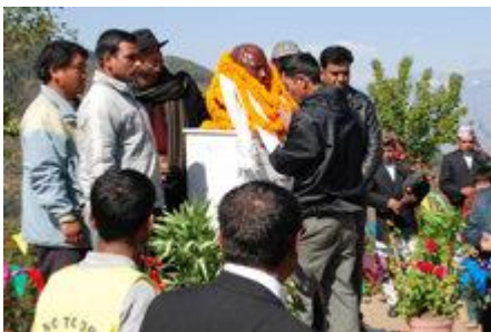
Cerimónia de inauguração para o Pico de L. RonHubbard no Nepal.

Um dos mais velhos corredores da droga na Terra vai desde o Triângulo Dourado do Sudeste da Ásia através do Reino do Nepal. Esta rota que forneceu o mundo com ópios durante um século ainda alimenta os hábitos por todo o Oriente e arruína populações.